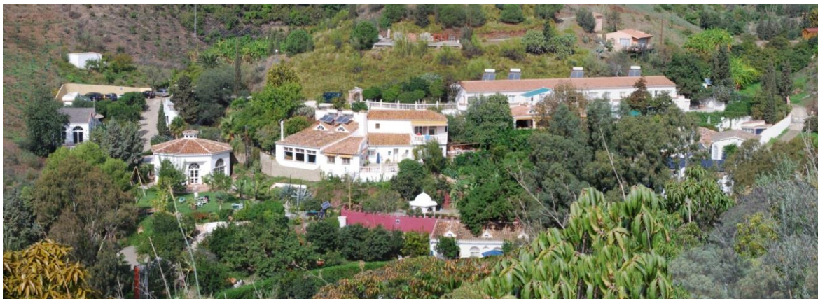
Casa el Morisco

Eine weitläufige Gartenlandschaft mit Swimmingpool, Sauna, Liegewiesen, indischem Garten mit Teich und Wasserfall, lauschigen Plätzen mit Hängematten, Bänken und Kissen laden zum Verweilen und Entspannen ein. Das vegetarische und vegane Essen wird mit viel Liebe zubereitet.