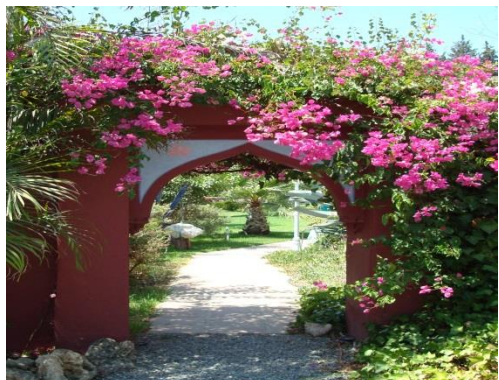
Außenbereich Casa el Morisco

Ich freue mich auf dich und grüße dich herzlichst